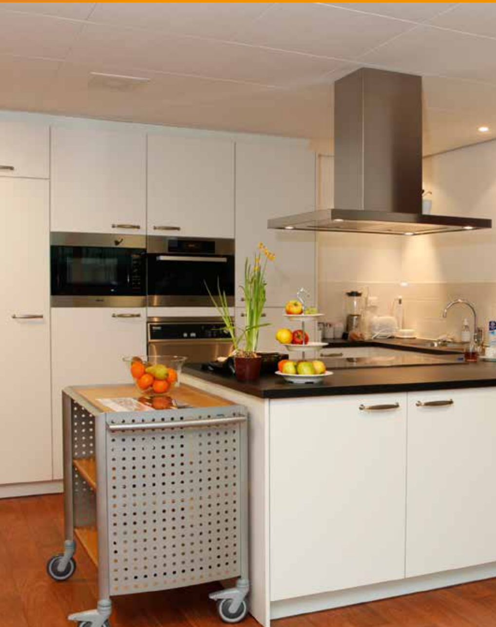
Keuken groepswooning Berkenhof