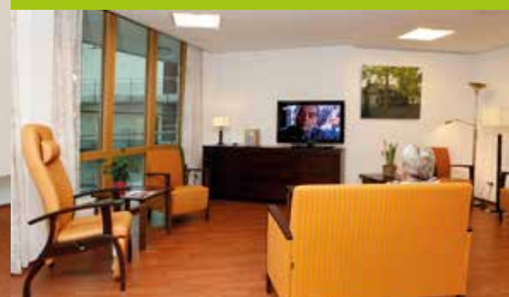
Woonkamer groepswooning Berkenhof