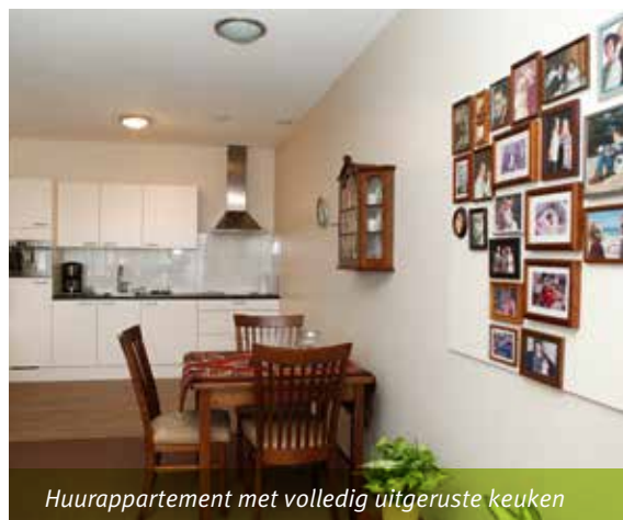
Huurappartement met volledig uitgeruste keuken

Mensen die een korte periode extra zorg nodig hebben, kunnen terecht in een van de twee logeerappartementen. Bijvoorbeeld na een ziekenhuisopname of als een mantelzorger uitvalt. Medewerkers van Berkenstaete leveren dan de zorg en begeleiding. Verwijzing verloopt via de cliëntadviseur.